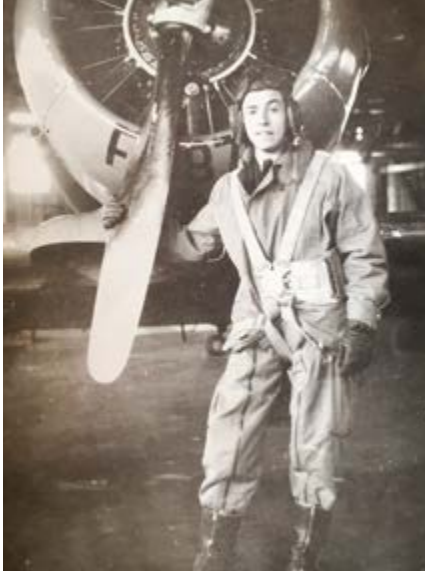
Bij mijn pilotentraining in Canada.